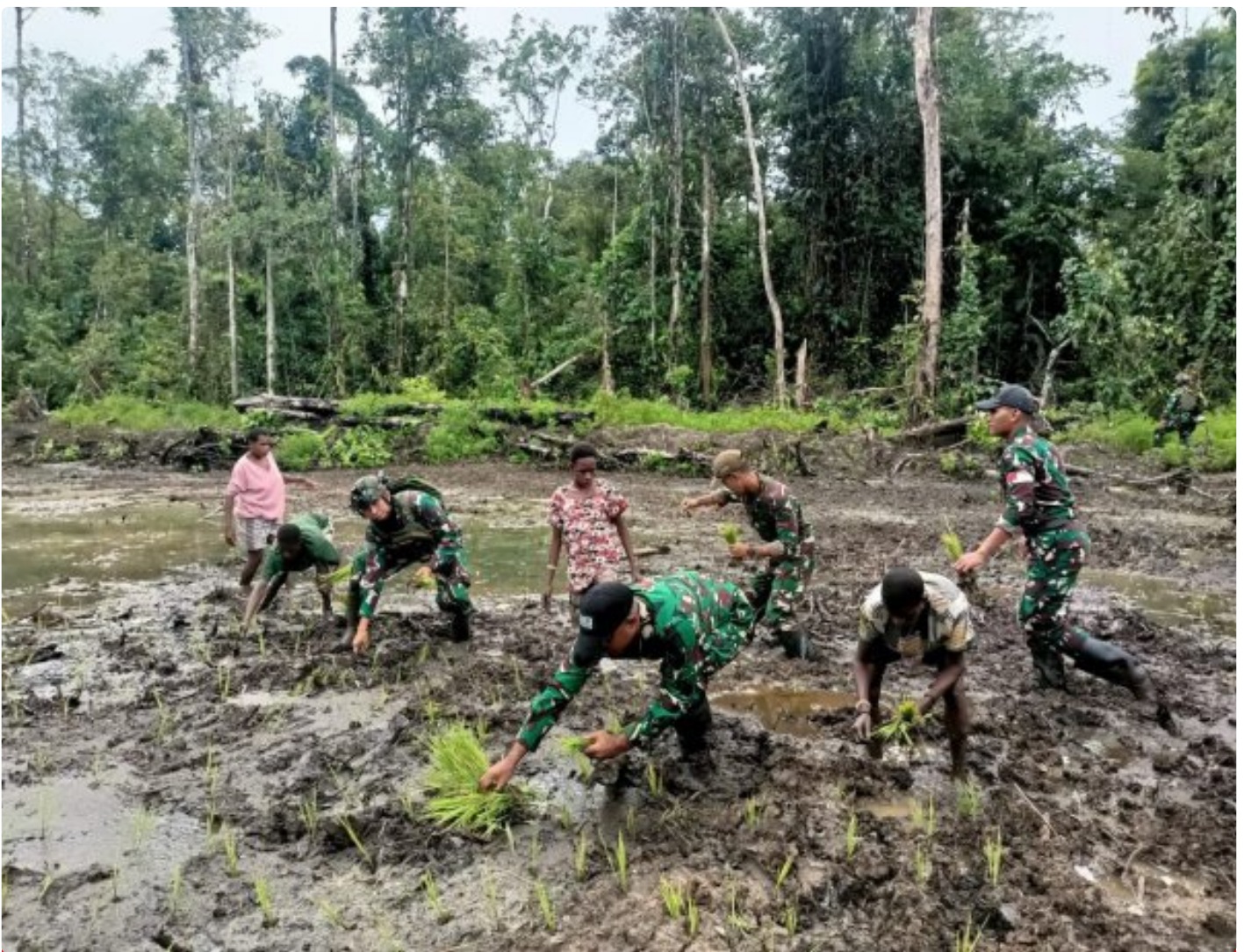
Foto: Satgas Pamtas Mobile RI-PNG Yonif 503/Mayangkara menggagas program ketahanan pangan yang melibatkan langsung warga Kampung Mumugu, Distrik Krepkuri, Kabupaten Nduga, Selasa (07/01/2025).

NDUGA- Dalam upaya membangun kesejahteraan masyarakat di wilayah penugasan Papua Pegunungan, Satgas Pamtas Mobile RI-PNG Yonif 503/Mayangkara menggagas program ketahanan pangan yang melibatkan