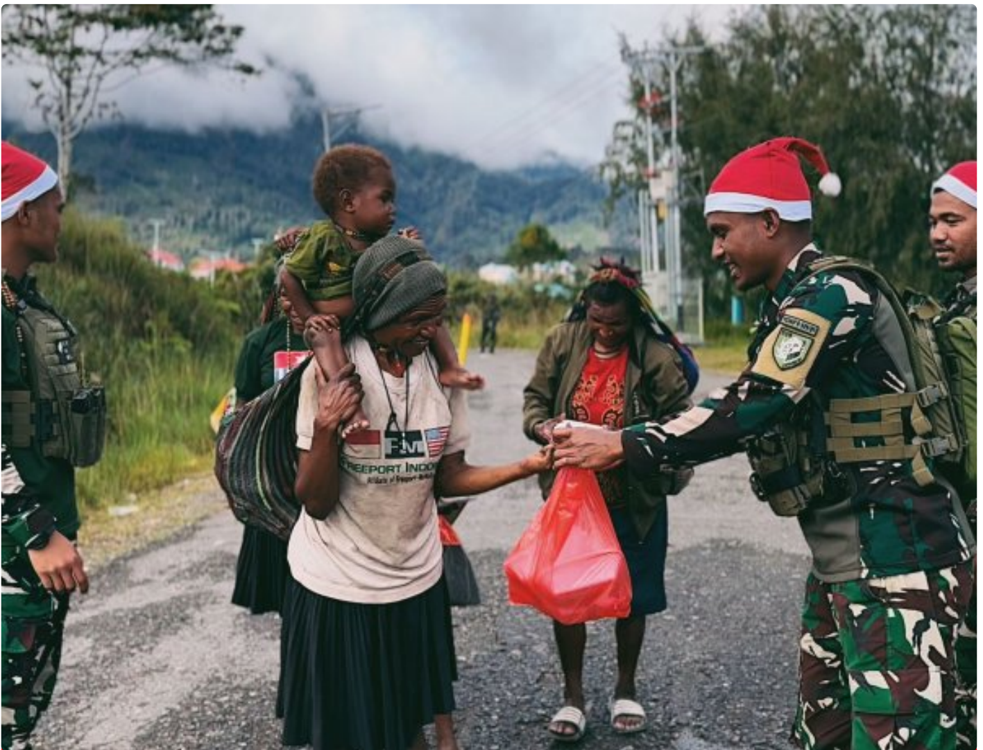
Foto: Satgas Yonif 509 Kostrad memberikan makna baru pada patroli keamanan dengan berbagi kebahagiaan bersama masyarakat di Intan Jaya, Papua.

PAPUA- Dalam balutan semangat Natal yang damai, Satgas Yonif 509 Kostrad memberikan makna baru pada patroli keamanan dengan berbagi kebahagiaan bersama masyarakat di Intan Jaya, Papua. Dipimpin oleh Pasiter Satgas, Lettu