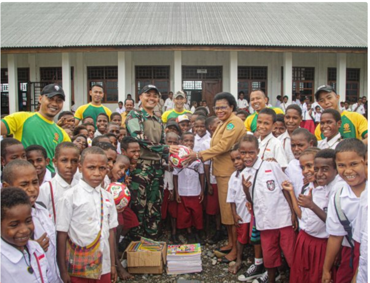
Foto: Satgas Pamtas Mobile RI-PNG Yonif 503/Mayangkara mendistribusikan sarana belajar ke SD Gabungan Distrik Kenyam, Kabupaten Nduga, Papua, pada Minggu (09/02/2025).

NDUGA- Dalam upaya mendukung pendidikan di daerah perbatasan, Satgas Pamtas Mobile RI-PNG Yonif 503/Mayangkara mendistribusikan sarana belajar ke SD Gabungan Distrik Kenyam, Kabupaten Nduga, Papua ,